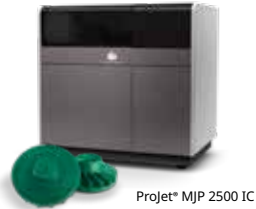
Projet* MJP 2500 IC

Productividad de impresión y nuevas eficiencias de fabricación con una producción de patrones de fundición impresos en 3D sin herramientas de 3D Systems