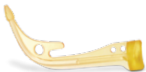
Figure 4 Production es compatible con toda la cartera de materiales NextDent® de 3D Systems para facilitar la personalización completa de los dispositivos de odontología. También puede elegir entre los materiales especializados de Figure 4 para la creación de herramientas temporales, fundición de joyería, aplicaciones médicas que requieren biocompatibilidad o esterilización, y mucho más.

Consulte la guía de selección de materiales y las hojas de datos de materiales individuales para conocer las especificaciones de los materiales disponibles.