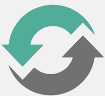
FIGURE 4 PRODUCTION COMPITE CON LA CALIDAD DE LAS PIEZAS MOLDEADAS POR INYECCIÓN CON UNA PRODUCCIÓN DIGITAL SIN HERRAMIENTAS PARA BRINDAR:

* Mejora del rendimiento comparado con otros sistemas de impresión 3D, a partir de distintos casos prácticos de la impresora Figure 4 Production; costo de las piezas comparado con las piezas y operaciones de fabricación tradicionales en un volumen de 500 piezas con la impresora Figure 4 Production.