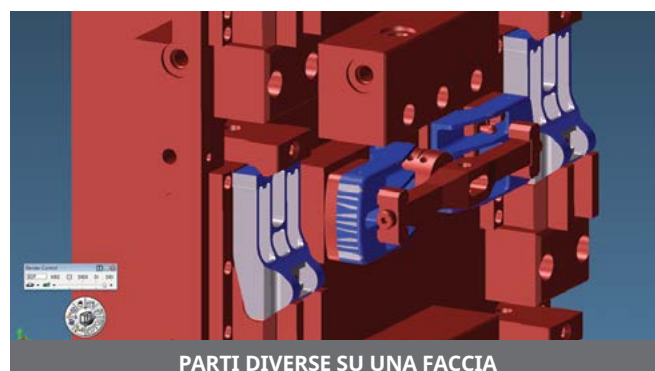
PARTI DIVERSE SU UNA FACCIA