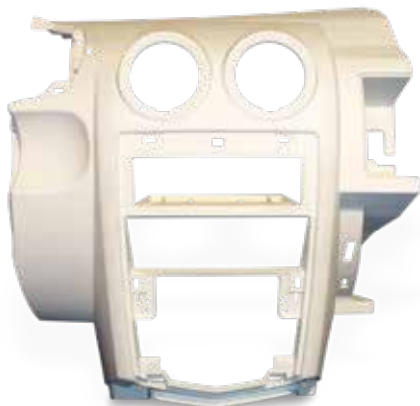
DuraForm PA Armaturen Brett