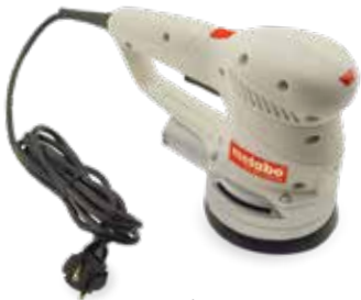
Gehäuse eines Schleifgeräts, gedruckt im Werkstoff DuraForm PA