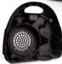
Rückseitige Staubsaugerabdeckung, gedruckt in DuraForm EX Black