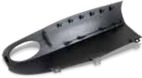
새로운 경질의 검정색 플라스틱 Visijet® CR-BK를 사용하면 훨씬 더 복합적인 기계적 성능을 얻을 수 있습니다.