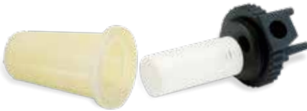
Clear, White 및 Black Rigid 플라스틱으로 프린트된 기능성 필터 원형