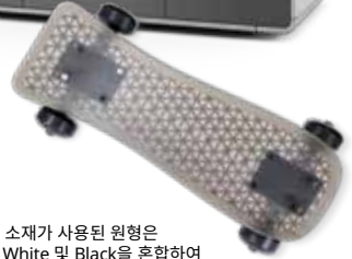
다양한 소재가 사용된 원형은 Clear, White 및 Black을 혼합하여 제품 구현 의도를 전달하고 마감 제품 시뮬레이션이 가능합니다.