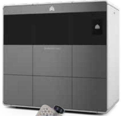
경질 및 엘라스토머 재료로 사실적인 의료 모델 인쇄

제품은 여러 가지 재료로 제작되며 —프로토타입은 다양한 각도에서 유연성, 투명성 및 차별화된 색조로 한 부분에 인쇄할 수 있으므로 3D 프린트에 훨씬 실제적인 기계적 특성과 차별화된 색상을 구현할 수 있습니다.