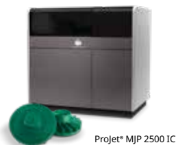
Projeto MJ2500 IC

Gerando produtividade e novas eficiências de fabricação com a produção de padrões de fundição impressos em 3D da 3D Systems