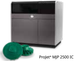
ProJet® MJP 2500 IC

Höhere Produktivität und Effizienz in der Fertigung mit werkzeuglosem 3D-Druck für die Gussmodellproduktion von 3D Systems