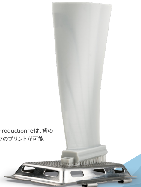
Figure 4 Production では、背の高いパーツのプリントが可能

3D Connect Service では安全なクラウドで 3D Systems のサービスチームとつながることで、プロアクティブかつ予防的なサポートを受けることができ、サービスが改善されています。また、アップタイムを向上し、システムの生産性を保証します。