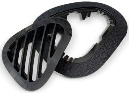
Figure 4 の剛性材料なら、鋳造ウレタンパーツや射出成型パーツのような外観と手触りを備えた耐久性の高いプラスチックパーツを生産できます。高速なプリントスピード、高い伸び率、非常に優れた衝撃強度、耐水/耐湿性、長期的な環境安定性なども備えています。