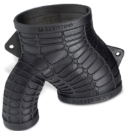
Figure 4 のエラストマー材料は、優れた形状回復性、高い引裂強度、圧縮強度、展性に優れており、機能的ゴム状パーツの生産に最適です。