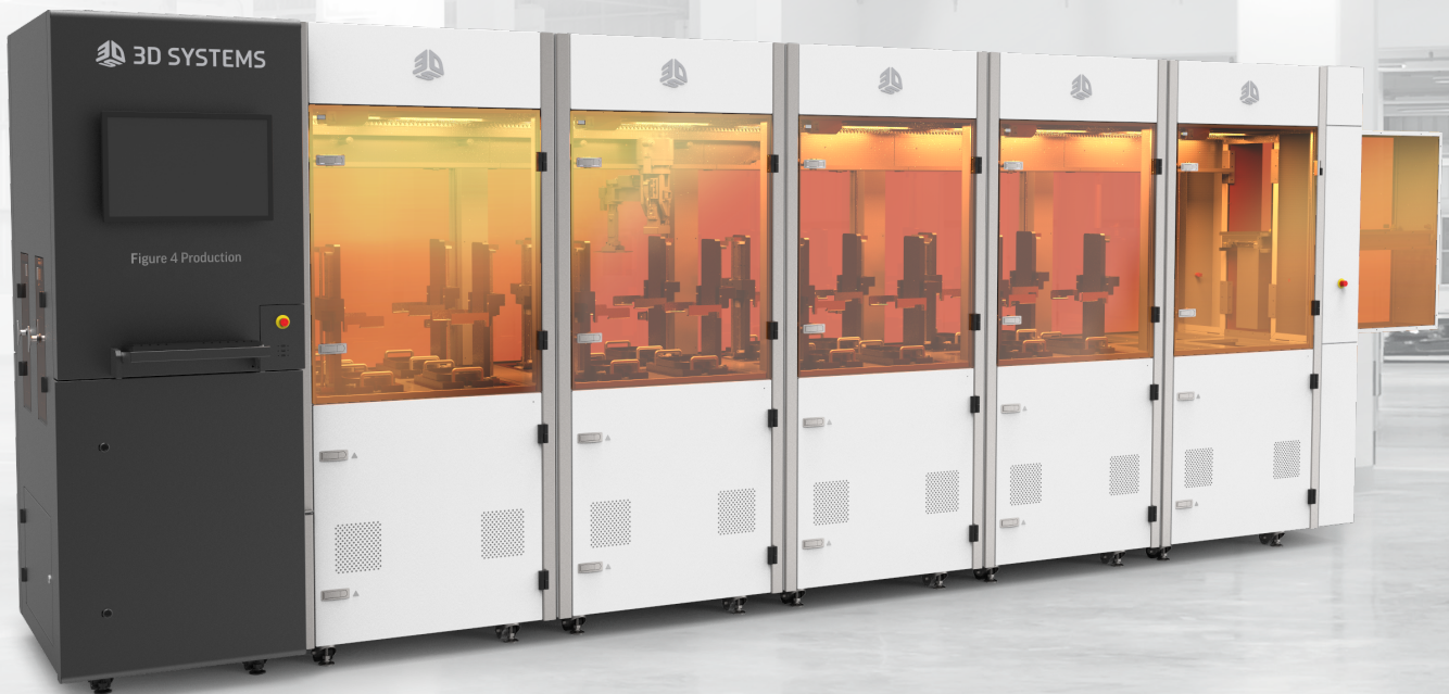
Figure 4 Production は、アディティブマニュファクチャリングの設計の柔軟性を、設定可能なインライン生産セルに組み込み、カスタマイズ可能かつ自動化可能のダイレクト 3D 生産ソリューションを提供します。

ダイレクトデジタル生産に対応 業界初のカスタマイズ可能な 完全統合型ファクトリーソリューション