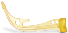
Figure 4 Production は、3D Systems の NextDent® 材料の全ポートフォリオに対応しており、歯科器具のカスタマイズに使用できます。Figure 4 の特殊材料は、サクリフィシャルツェリングやジュエリー鋳造、生体適合性や滅菌などを必要とする医療用途などに最適です。

利用可能な材料の仕様については、材料選択ガイドおよび個別の材料データシートを参照してください。